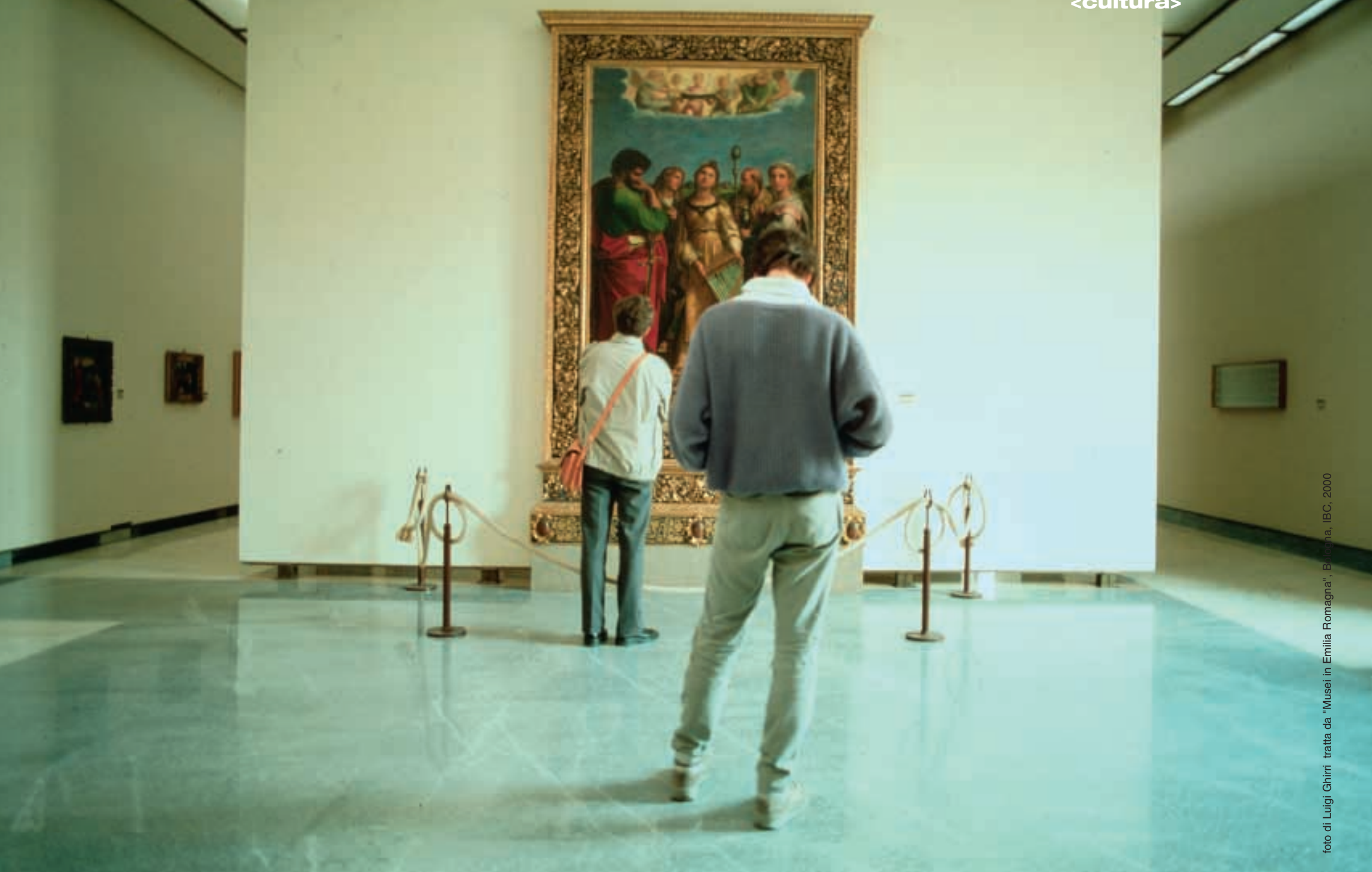
foto di Luigi Ghirri tratta da "Musei in Emilia Romagna", Bologna, IBC, 2000

iniziativa della regione con i ministeri delle attività culturali di Italia, Francia e Regno Unito