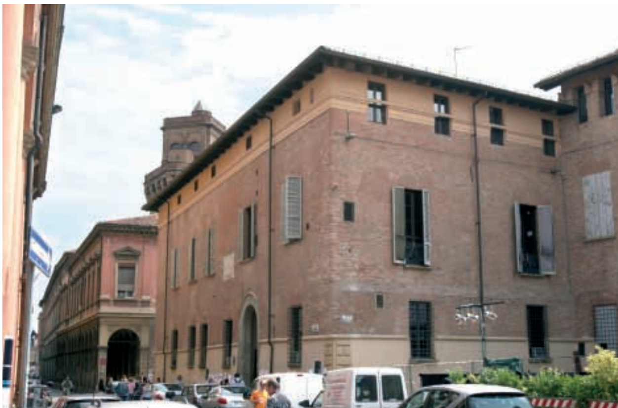
■ Via Zamboni, sede dell'Università di Bologna