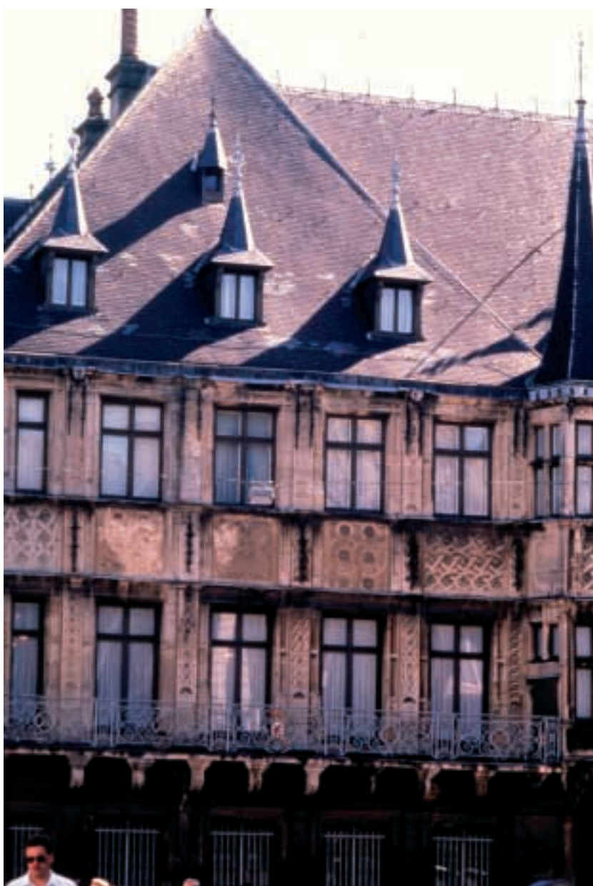
■ uno scorcio della città di Lussemburgo

La Gran Bretagna ha assunto la presidenza di turno dell'Unione europea. Il suo mandato durerà fino al 31 dicembre di quest'anno. Tony Blair, primo ministro dell'Uk, nel suo discorso di insediamento ha sottolineato la necessità che la Ue intraprenda la strada delle riforme affinché, a suo dire, possa affrontare i complessi problemi dell'economia mondiale. Presentando la sua ricetta per l'Europa al Parlamento di Bruxelles (un'assemblea un po' critica considerando i risultati dell'ultimo Consiglio europeo) Blair ha parlato di un futuro "fatto di investimenti nelle capacità intellettuali, nell'istruzione, nell'università, un sistema di welfare attivo" sottolineando che "non è tempo di accusare di tradimento chi vuole cambiare l'Unione europea, ma di accettare il fatto che solo attraverso il cambiamento l'Unione può rafforzarsi e diventare più rilevante". In pratica "si tratta di modernizzare l'Ue e non di abbandonarla". Il Primo ministro inglese ha poi ribadito che intende sfruttare i sei mesi della presidenza per cercare un accordo sul bilancio e ribadendo che esso, il bilancio, dovrebbe essere "il più contenuto possibile, perché in tutta l'Ue vi sono delle difficoltà economiche. L'importante - ha concluso - è che sia speso bene". Alla Gran Bretagna seguirà alla presidenza dal primo gennaio 2006 l'Austria e poi la Finlandia.