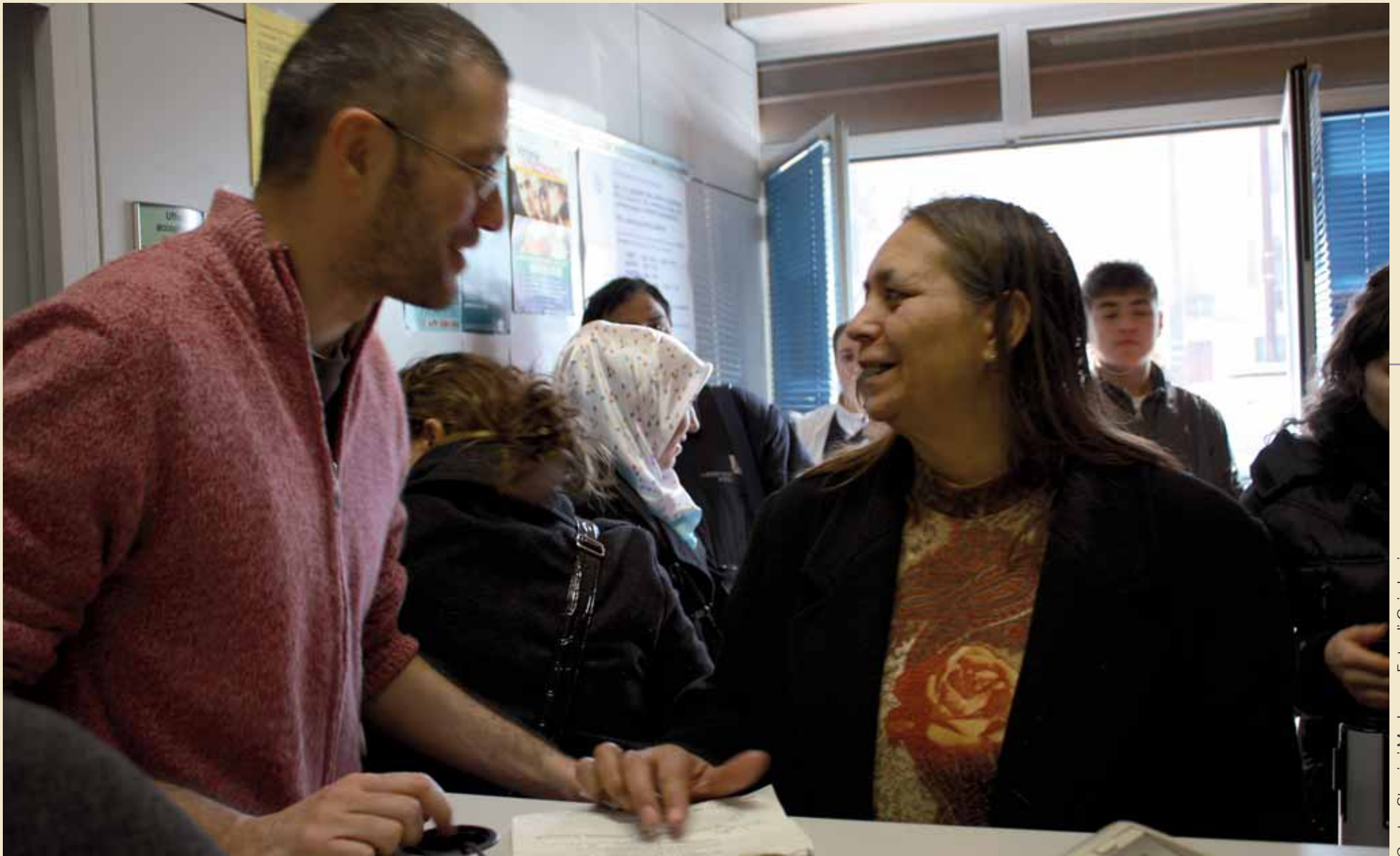
Centro Stranieri Modena