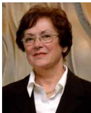
Anna Maria Dapporto assessore regionale alla Promozione delle politiche sociali

Nella ripartizione delle risorse, che ammontano a circa 84 milioni di euro, la regione ha considerato prioritari alcuni ambiti quali l'infanzia e l'adolescenza, l'immigrazione, povertà ed esclusione sociale, lotta alla tratta, carcere e dipendenze. Il tutto in un'ottica di dare più autonomia ai Comuni attraverso il Fondo sociale locale: un nuovo strumento, nel quale confluiscono sia risorse regionali che comunali, che agisce su ambito distrettuale e finanzia gli interventi realizzati dai Comuni in base alle priorità individuate dal piano di zona distrettuale per la salute e il